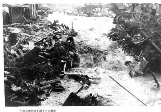
宇治川商店街(神戸市中央区下山手通)