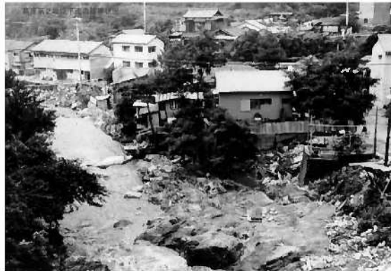
天王谷川(神戸市兵庫区平野町)