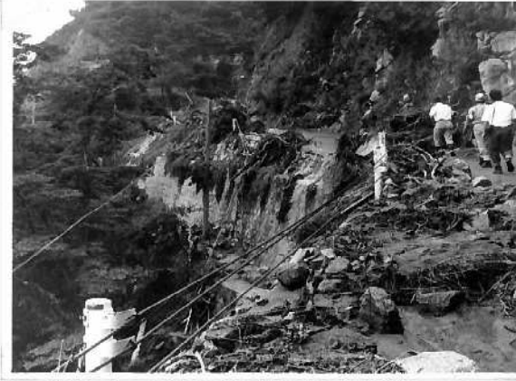
市ヶ原の山腹崩壊地付近 (神戸市中央区)