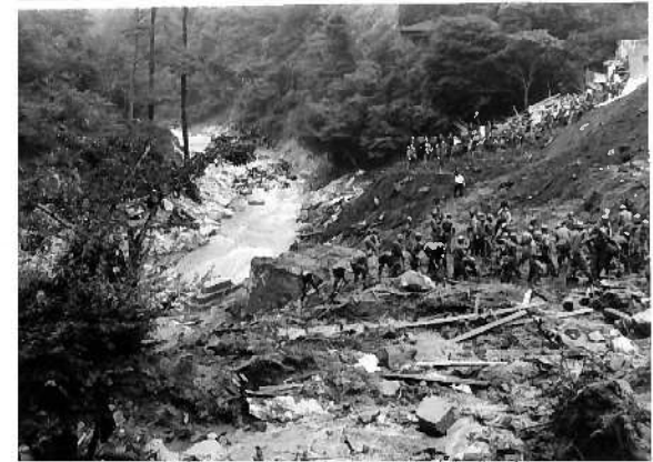
市ヶ原の山腹崩壊地付近 (神戸市中央区)