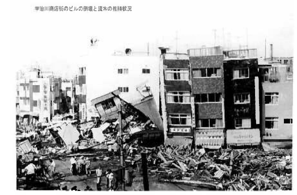
宇治川商店街(神戸市中央区下山手通)