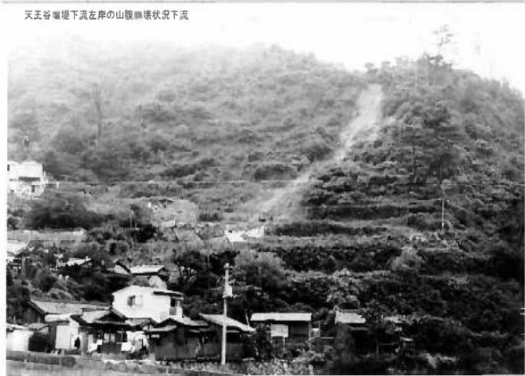
天王谷川左岸の山腹崩壊状況下流 (神戸市兵庫区平野町)

昭和42年（1967年）災害によって、上流域下流域ともに甚大な被害を受けました。