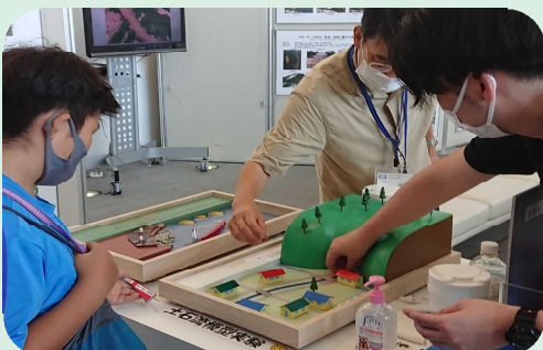
土砂災害小型模型 土石流や崖崩れ、地すべりについて模型で学ぶことができます