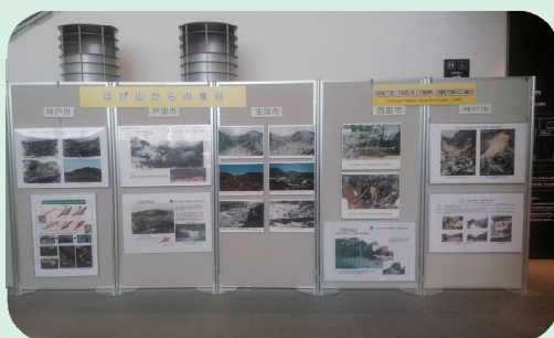
パネル展示及び映像等のモニター上映 昭和13年・42年の豪雨災害や、平成7年阪神・淡路大震災の被害・復旧状況等をパネルや映像で紹介します