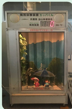
降雨体験装置 カップくん 雨量の違い（小雨（10mm/hr）～ 豪雨（100mm/hr））を感じていただけます