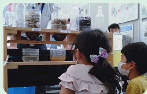
森林の浸透機能の比較実験装置 森林の保水機能を確認できます