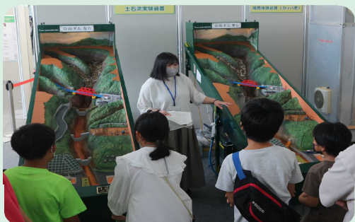
土石流模型実験装置 土石流の怖さや治山ダムの役割が体感できます