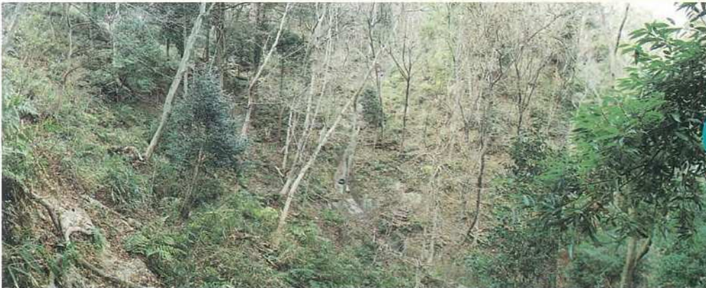
神戸市中央区神戸港地方字口一里山(再度ドライブウェイ・錨山北斜面)