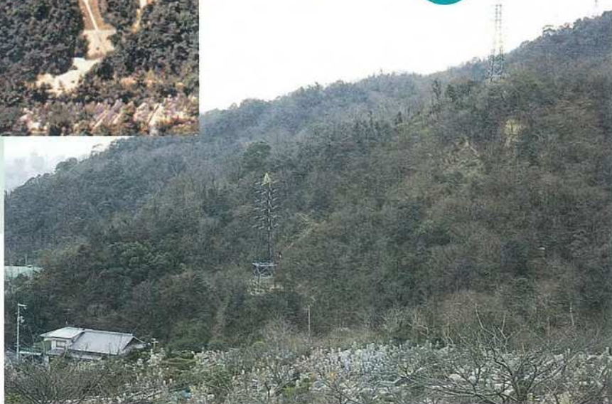
神戸市灘区大石字長峰山 (杣谷川上流西斜面)