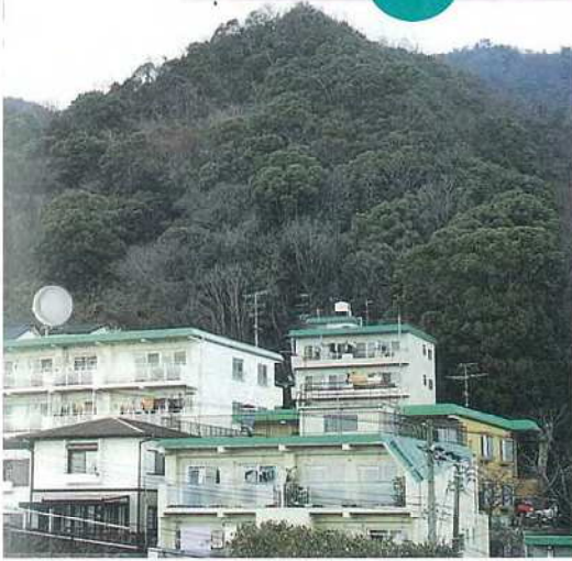
神戸市灘区上野字高尾山(摩耶ケーブル下車・東斜面)