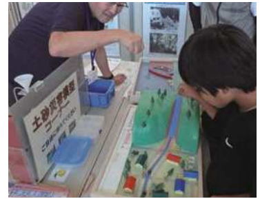
地すべりの要因と実験対策工の実験