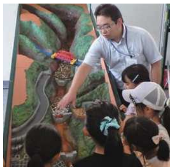
土石流模型実験装置の実演

土石流の発生を再現し、土砂災害の被害状況や治山ダムの効果を体感できる「土石流模型実験装置」、花崗岩と森林土壌の保水力を比較する「保水力実験」、降雨体験装置「かっぱくん」の実演