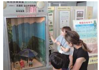
降雨体験装置の実演