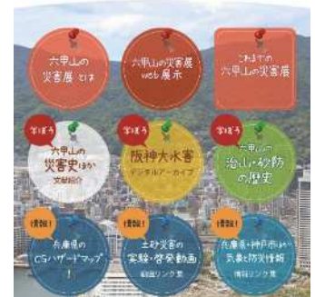
常設版 六甲山の災害展 (神戸県民センター 六甲治山事務所ホームページ)